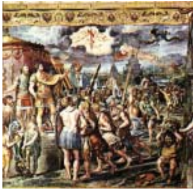
«IN HOC SIGNO VINCIS» — «С ЭТИМ ПОБЕДИШЬ» После видения креста (вверху), император Константин (справа) не только сам принял христианство, но и сделал его инструментом государственной власти

Император призывал Александра с Арием прекратить споры «о словах». Языческие философы в подобных ситуациях поступали лучше: они тихо соглашались в несогласии. Но эти новые философы были непримиримы и становились врагами его миру, а потому подрывными элементами государства. Константин пишет в конце письма: «Зная, что наш великий и благой Бог Вседержитель дал нам общий свет Своей благодати, я умоляю вас, дабы мои старания привели к успешному окончанию, и мой народ был вразумлен воспользоваться покоем и согласием. Позвольте мне провести дни и ночи мои в тишине и покое, и да имею я свет и веселие вместо слез и вздыханий». Константин искренне надеялся