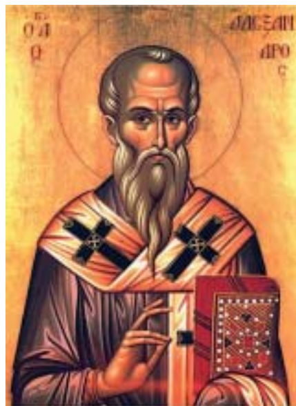
АЛЕКСАНДР, ЕПИСКОП АЛЕКСАНДРИЙСКИЙ Прекрасно понимая опасность нового лжеучения, он стал в главе борьбы с арианством

Константин не особенно удивился, когда Арий разразился длинным речитативным песнопением. Прирожденный агитатор и пропагандист, Арий представлял свое учение в виде легко запоминаемых популярных песен и стихов. Их с удовольствием распевали широкие слои населения — и